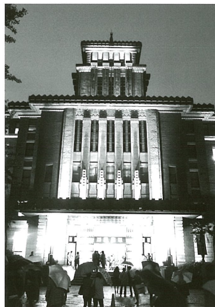
(神奈川県横浜市中央区日本大通1 神奈川県庁本庁舎)